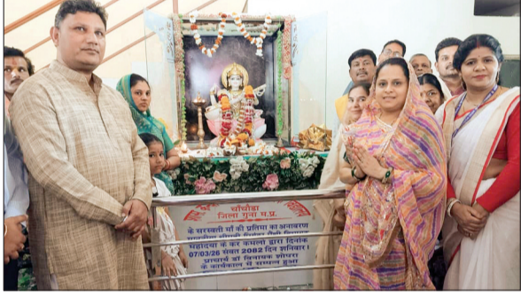
हरिभूमि न्यूज़ | चाचौड़ा